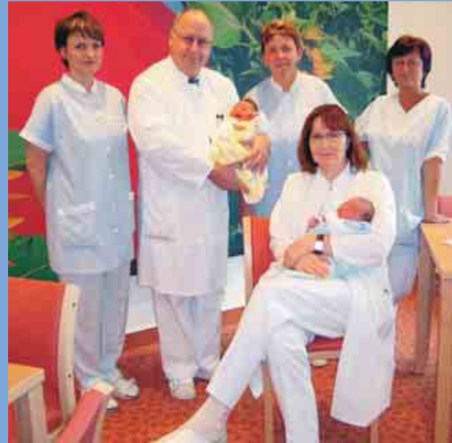
Ärzte- und Schwesternteam am Standort Zittau

Liebe werdende Eltern, egal wie und für welchen Kreißsaal, welche Klinik Sie sich entscheiden: Wir wünschen Ihnen auf jeden Fall ein schönes Geburtserlebnis und dann viel Freude an Ihrem neuen Lebensmittelpunkt Ihrem Baby.