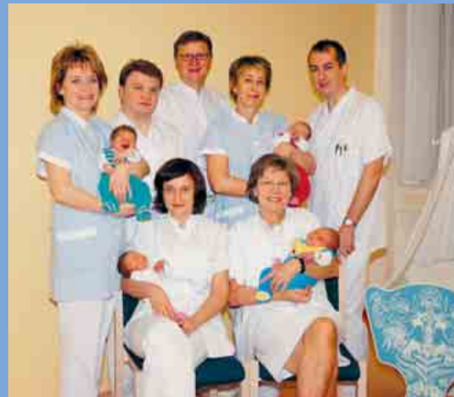
Ärzte- und Schwesternteam am Standort Ebersbach