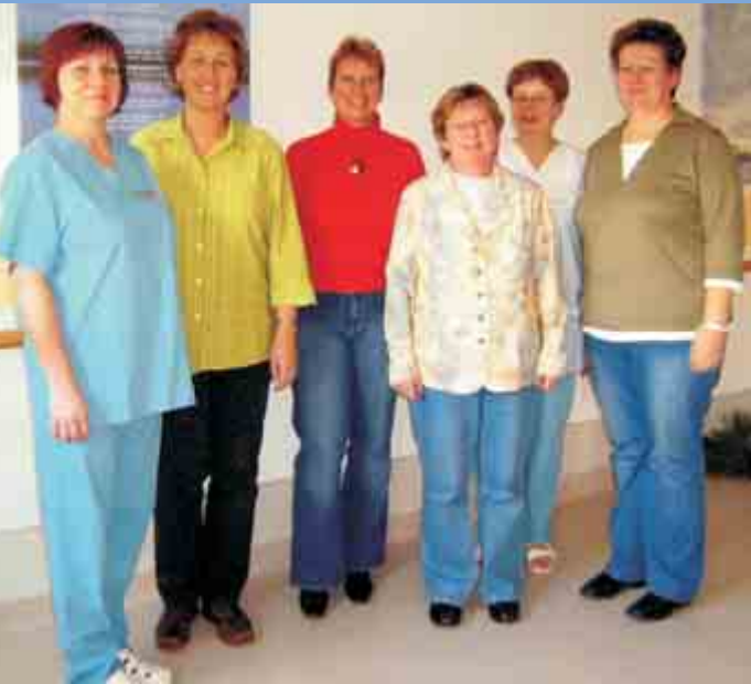
Hebammenteam am Standort Zittau