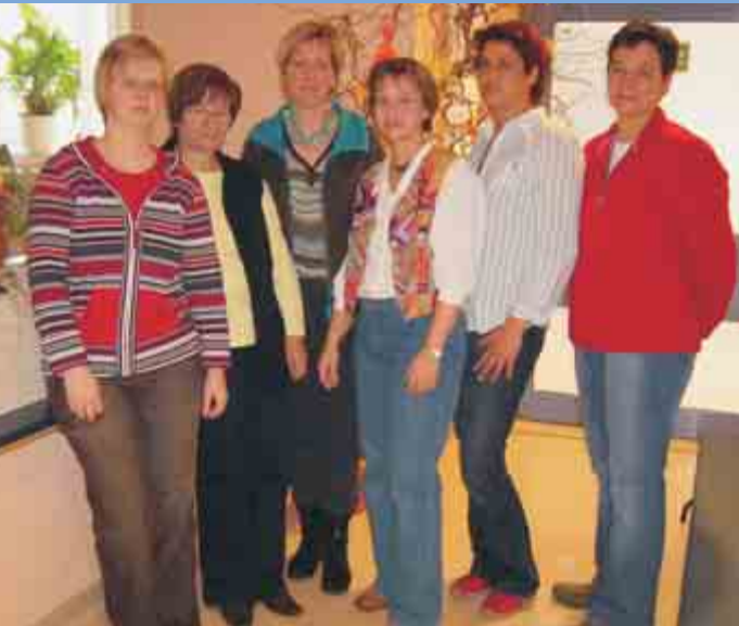
Hebammenteam am Standort Ebersbach